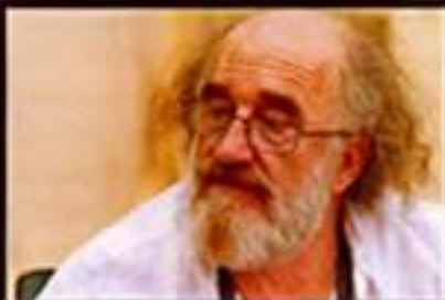
让·皮埃尔·切瓦体·阿涅斯教授