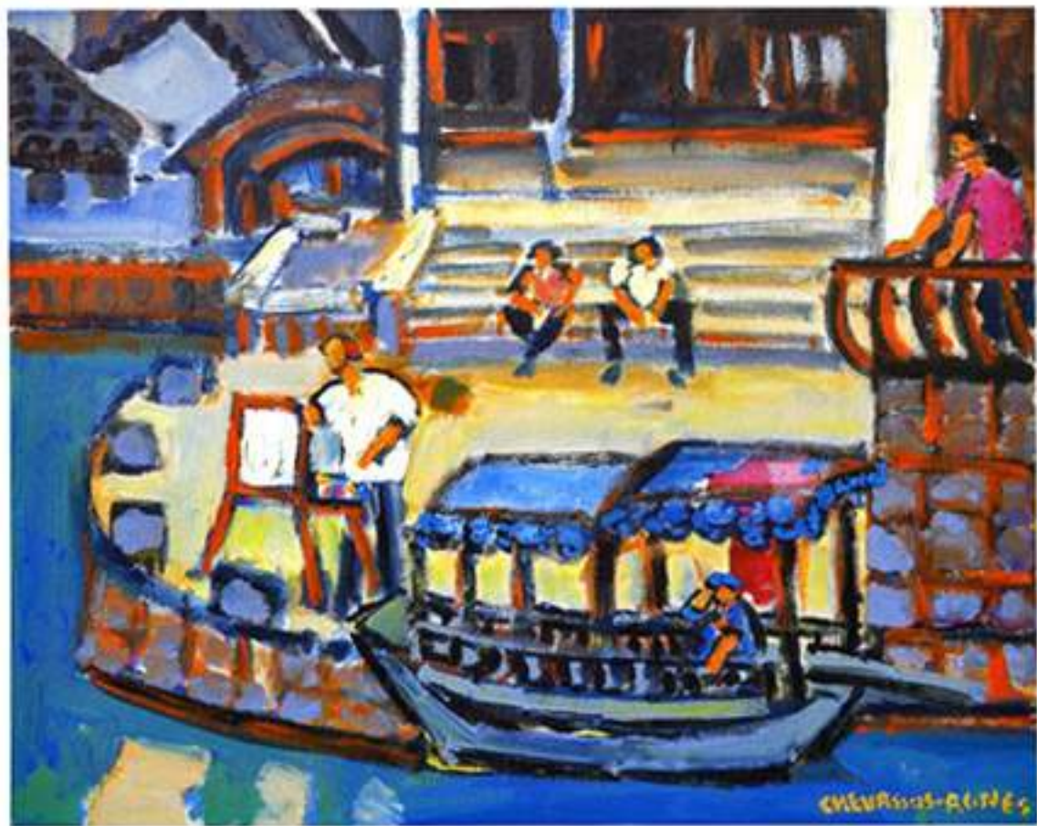
法国画家眼中的奥河 100×80cm